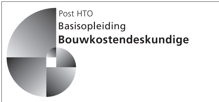
2. Logo basisopleiding bouwkostendeskundige

Later werd dit logo vervangen door een modernere versie (afbeelding 2).