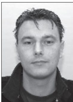
H. J. Bergsma, Bureau Documentatie Bouwwezen

De BDB Trends in figuur 1 geeft de verwachting voor de aanbestedingsmarkt in de komende twee jaar weer. In figuur 1 is te zien dat de aannemende partijen steeds scherper zullen inschrijven om werk naar zich toe te trekken en zo hun personeel aan het werk te houden. Dit zal resulteren in inschrijvingen die gemiddeld 10% onder het structurele kostenniveau komen te liggen. Dit is het gevolg van het afnemend aantal projecten, waardoor aannemers uiteindelijk onder kostprijs inschrijven om continuïteit in productie te behouden.