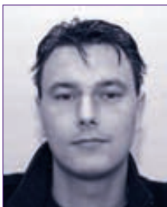
H.J. Bergsma Bureau Documentatie Bouwwezen