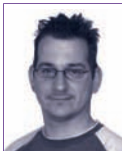
ir. T.A.L. Peek Bureau Documentatie Bouwwezen